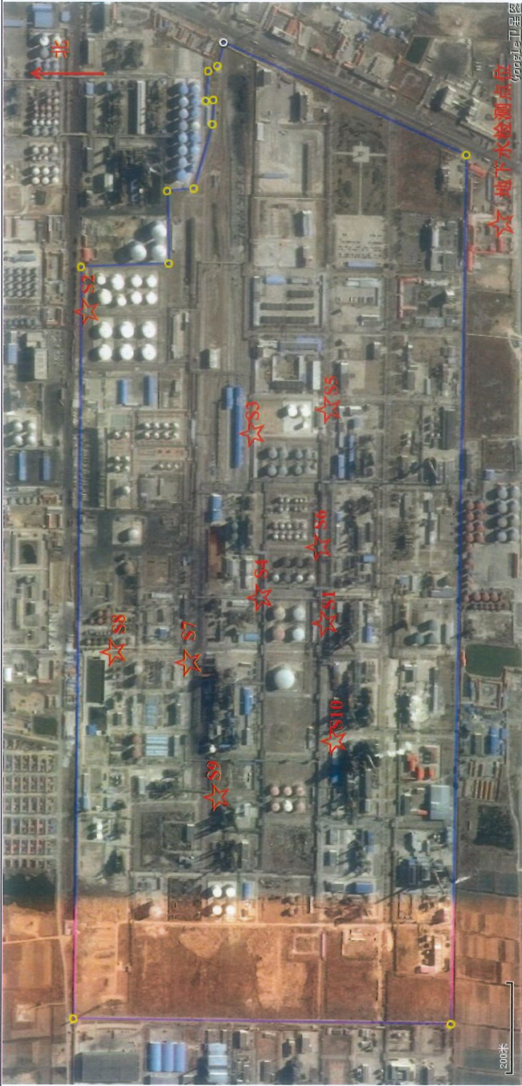
图 1 地下水检测点示意图

报告书包括封面、首页、正文（附页）、封底，并盖有计量认证章、检验检测专用章和骑缝章。