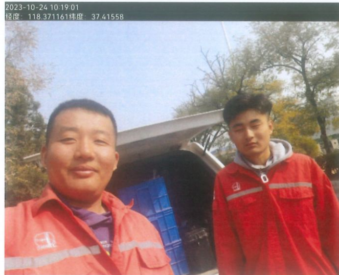
图 2 检测前合影